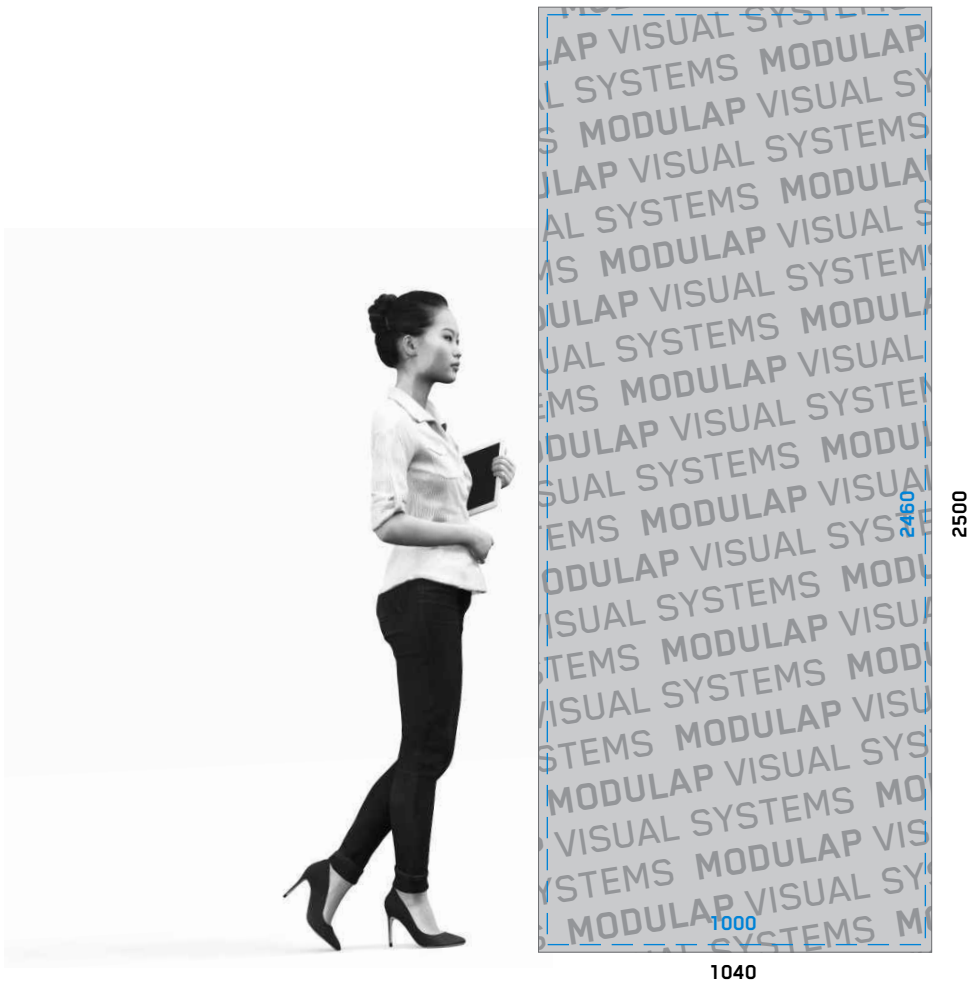
BEISPIEL: MOTIV ÜBERGREIFEND ÜBER 2 ODER MEHR MODULE EXAMPLE: OVERLAPPING MOTIFS COVERING 2 OR MORE MODULES