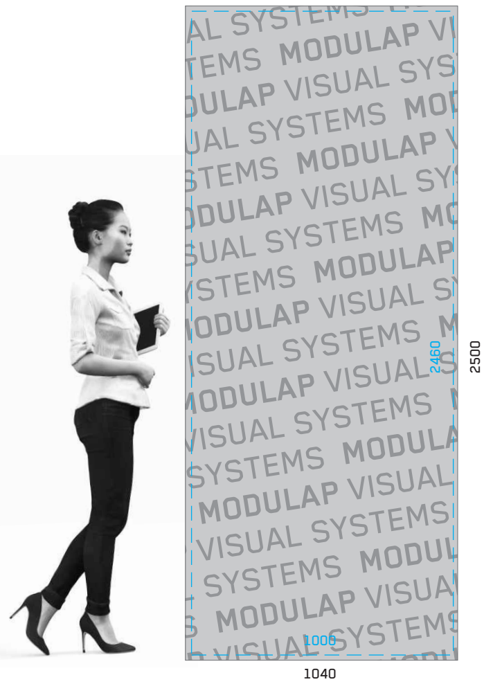
BEISPIEL: MOTIV ÜBERGREIFEND ÜBER 2 ODER MEHR MODULE EXAMPLE: OVERLAPPING MOTIFS COVERING 2 OR MORE MODULES