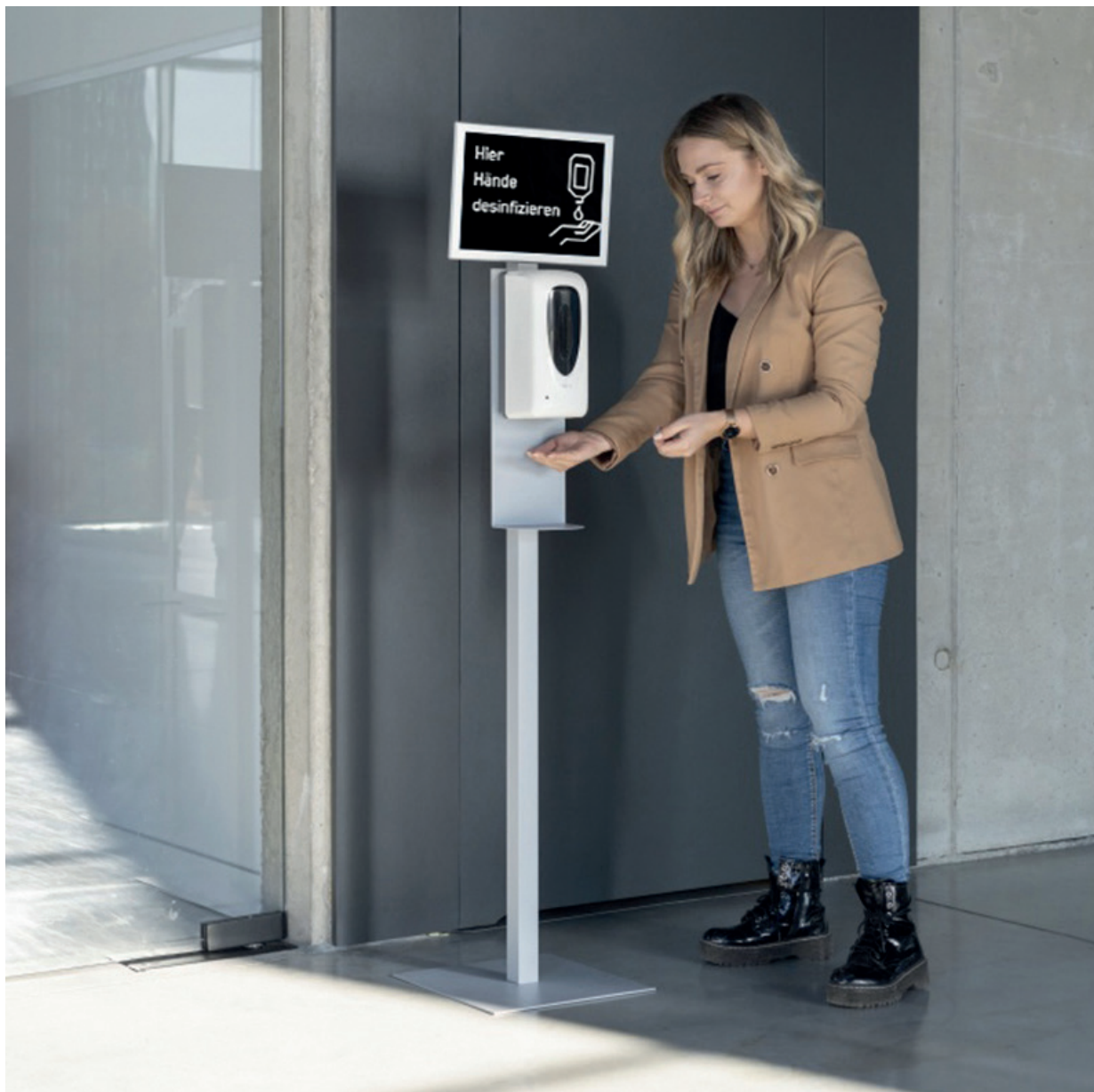
Desinfektionsspender - Serie Disinfectant dispenser - series