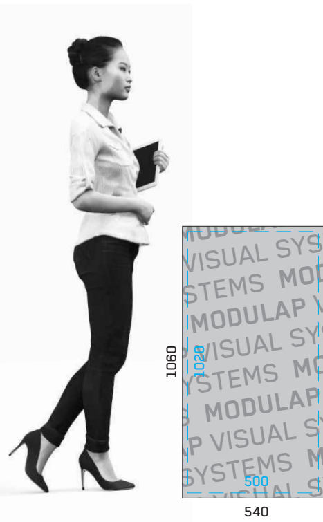
RÜCKSEITE BLANCO BLOCKOUT MIT ÖSE BACKSIDE BLANCO BLOCKOUT WITH EYELET