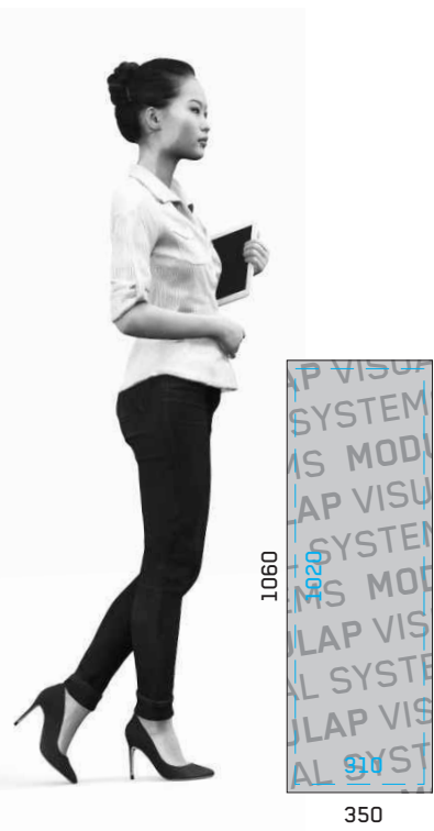
RÜCKSEITE BLANCO BLOCKOUT MIT ÖSE BACKSIDE BLANCO BLOCKOUT WITH EYELET